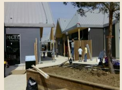
chantier en cours